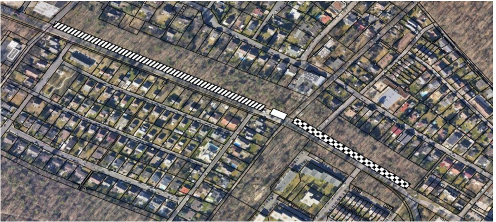
Abb. 1: Aufteilung der Flughafenstraße für verschiedene Arten der Entwicklung blütenreicher Flächen. Gestreift: Wiesenherstellung durch Mahdanpassung, weiß: Staudenmischpflanzung, kariert: Neuanlage Wiese mit Abmagerung der Fläche und Neueinsaat

bis sie sich voll entwickelt haben, manche Arten beginnen erst im Jahr nach der Ansaat zu keimen. Bis zur vollständigen Entwicklung können bei fachgerechter Pflege drei oder mehr Jahre ins Land ziehen. Die Wiese wird je nach Wüchsigkeit ein- bis zweimal im Jahr gemäht. Im Randstreifen wurden Gräser angesät, die über das Jahr kurzgehalten werden sollen. Im westlich an das Staudenbeet anschließenden Bereich der Flughafenstraße soll der Rasen weiterhin als Langschnittwiese entwickelt werden (Abb. 1: gestreift). Dies wird durch einen ein- bis zweimaligen Schnitt erfolgen, im Weiteren soll aber ein Randstreifen regelmäßig gemäht werden, um der sich entwickelnden Wiese