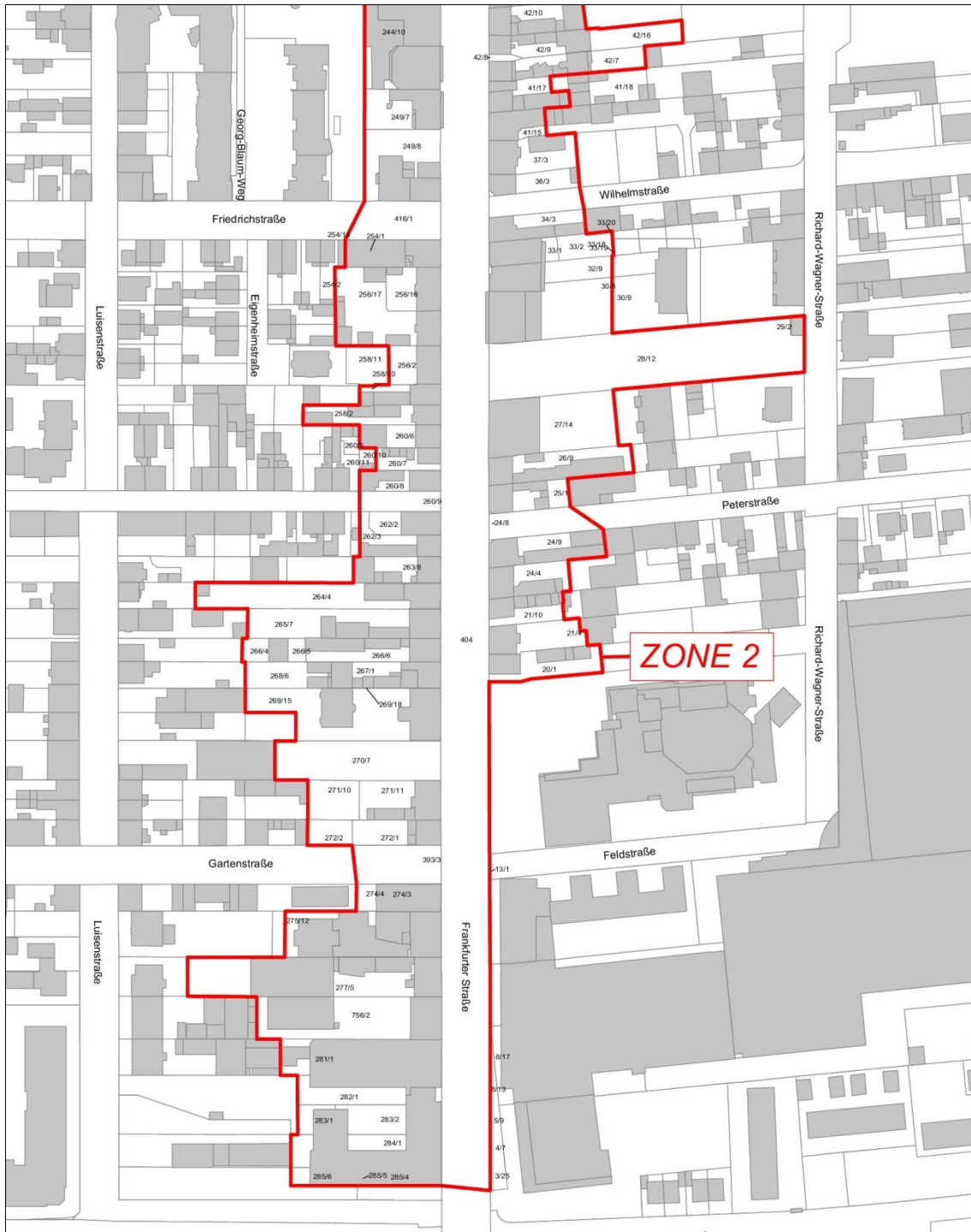
Blatt 3 von 3 / Maßstab 1:2.500