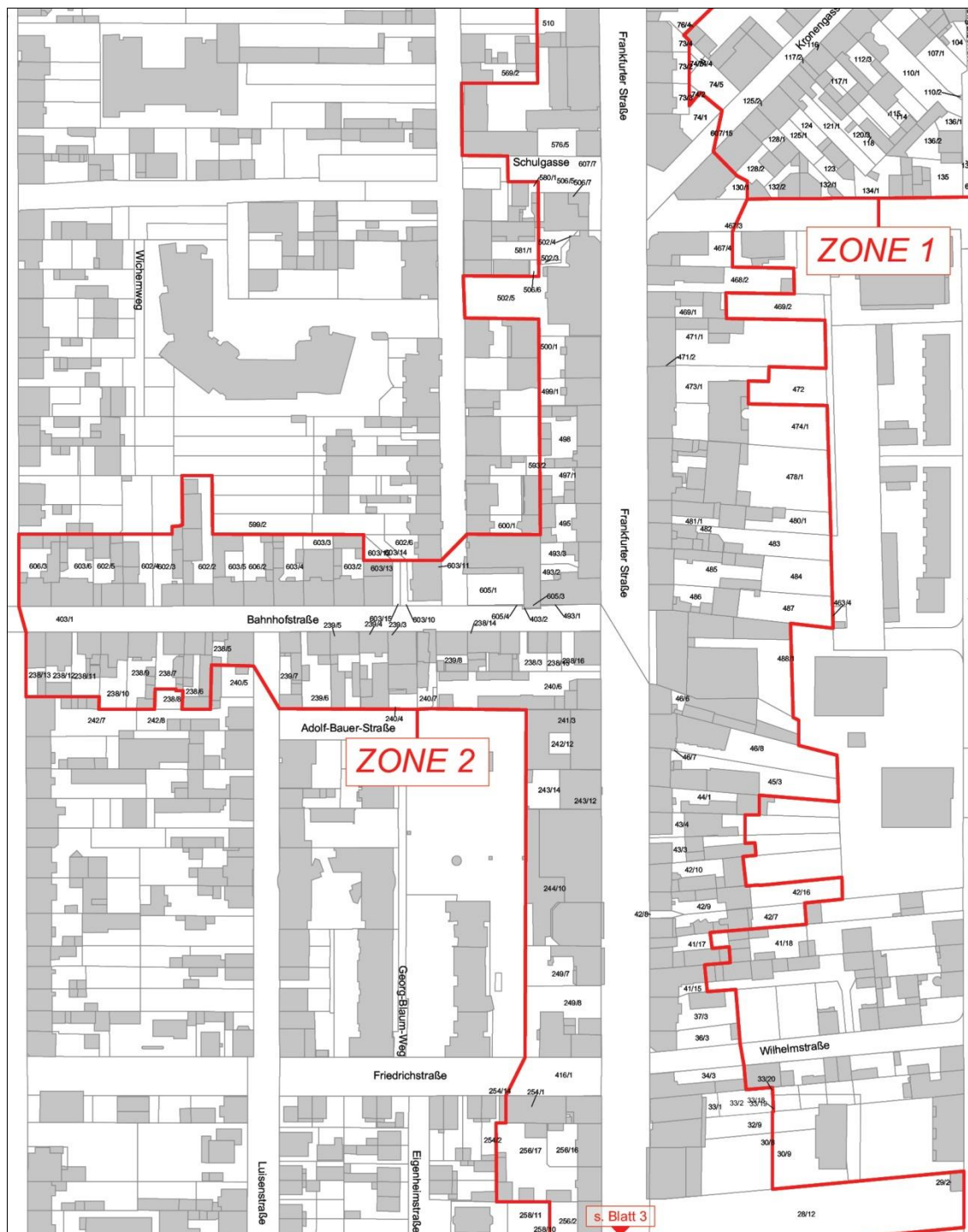
Blatt 2 von 3 / Maßstab 1:2.500