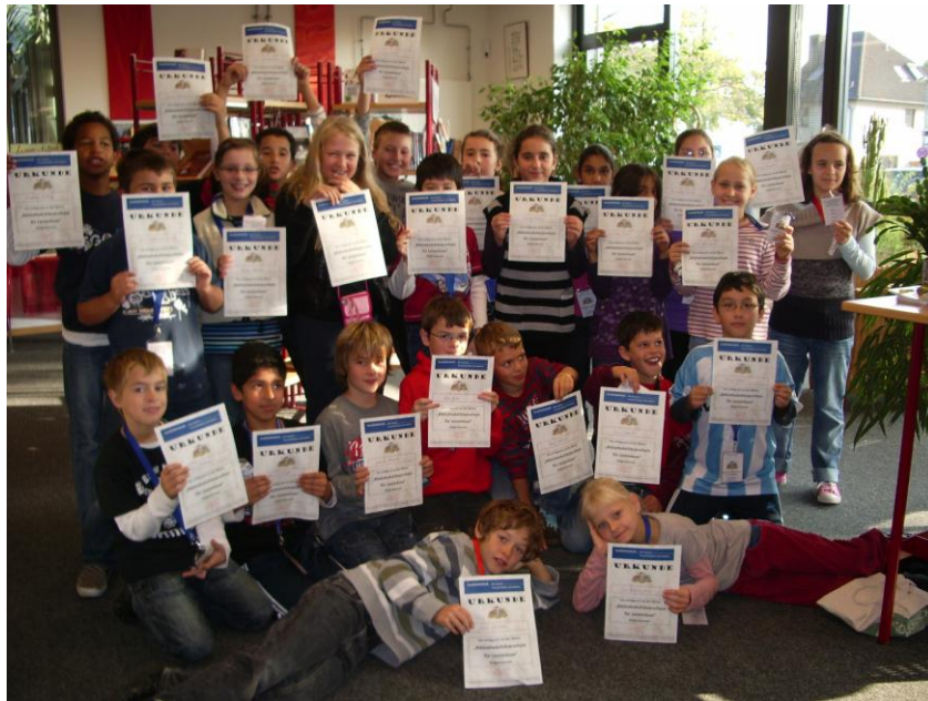
Klasse 4c der Wilhelm-Hauff-Schule in der Westend-Bibliothek