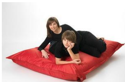
Fritz - Sitzsack

Die kommenden Veranstaltungstermine entnehmen Sie bitte dem beiliegenden Handzettel.