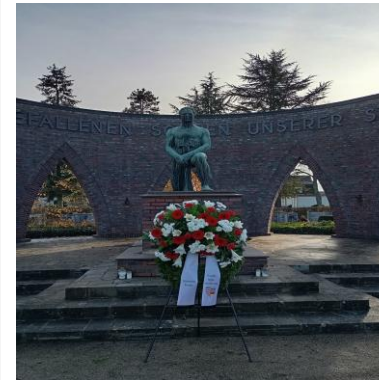
Rede des Jugendforum Am Volkstrauertag