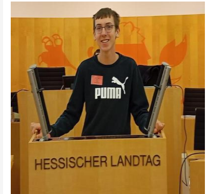
Jugendlandespolitik beim HOP!