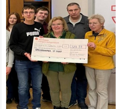
Spende an die Speisekammer